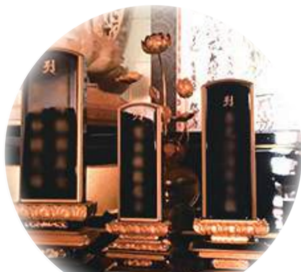
お位牌の永代供養