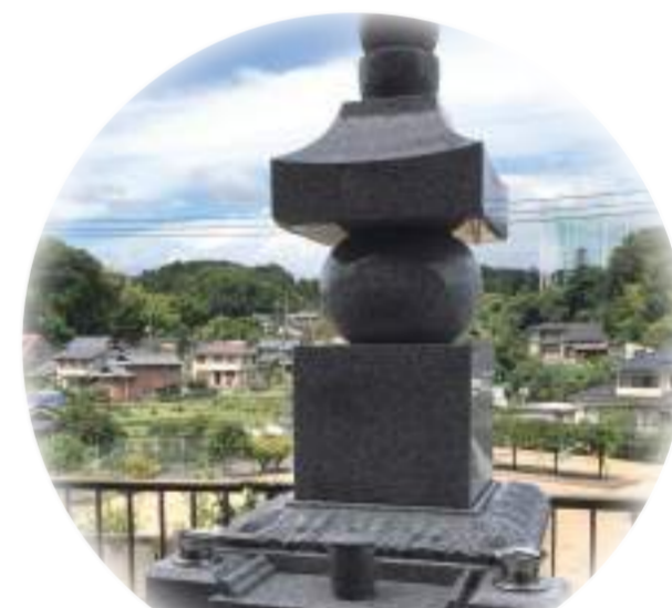
永代供養墓あります