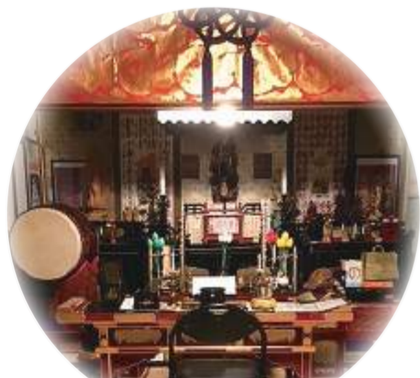
法要会場あります