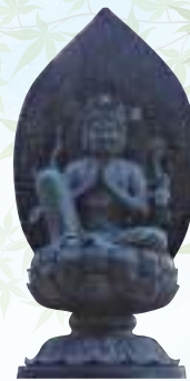
(西国三十三所第27番)

馬頭観音様は、動物救済の仏様です。頭に馬の顔を乗せ、憤怒の形相をさされていきます。